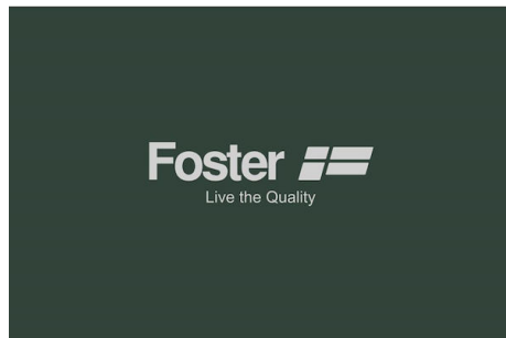
Gitter aus Edelstahl 9401 175